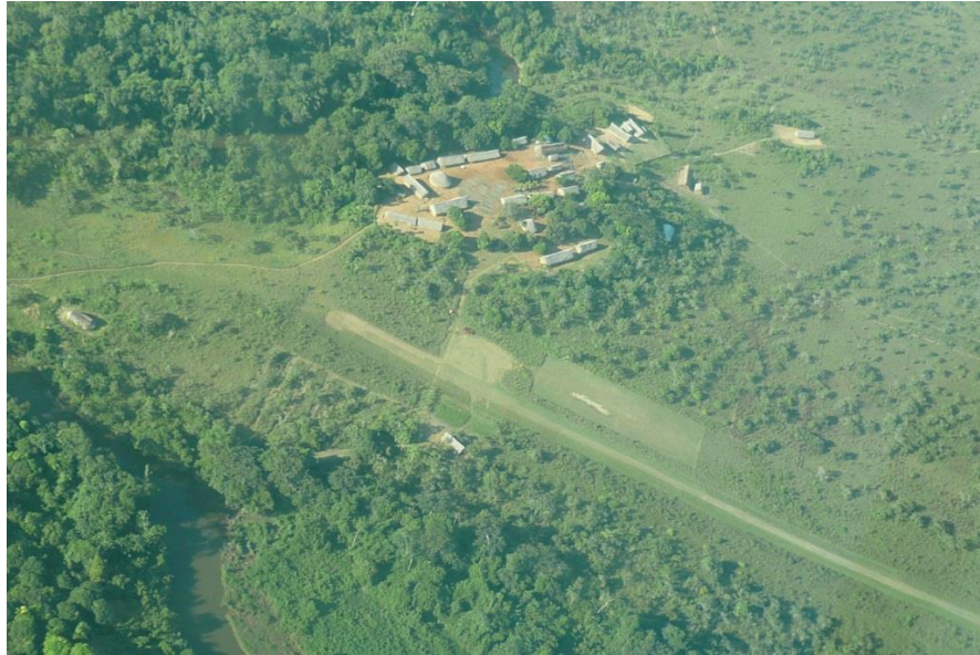
Vista aérea de la Comunidad San José de Kayama – Sierra de Maigualida