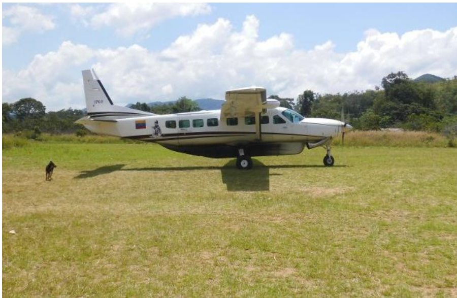
Momento en que el Grupo Aéreo de Transporte N°9 se lo llevan para Ciudad Bolívar para las averiguaciones e investigaciones.