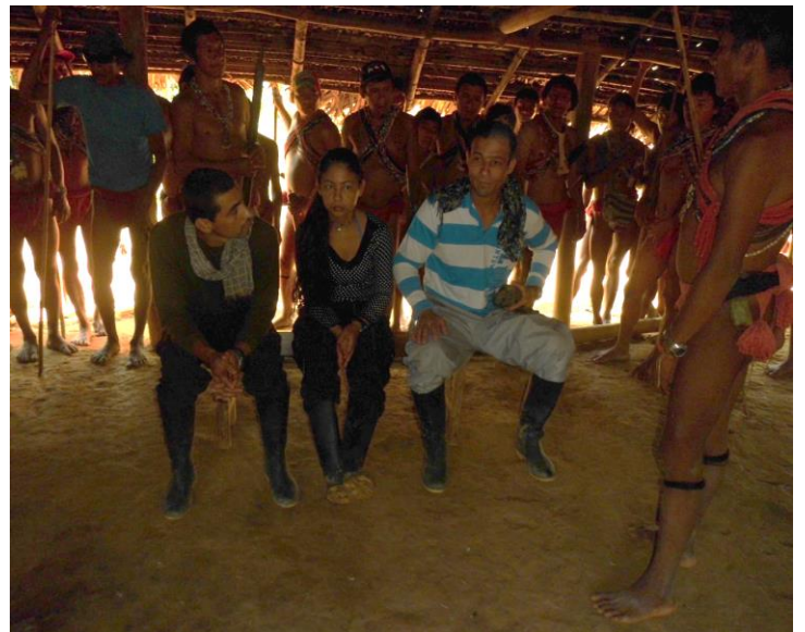
Momentos en que los tres "GUERRILLEROS" piensan como responder las preguntas hechas por el jefe general, es donde comienza a mentir que supuestamente envió el presidente de la República Bolivariana de Venezuela Nicolás Maduro Moros