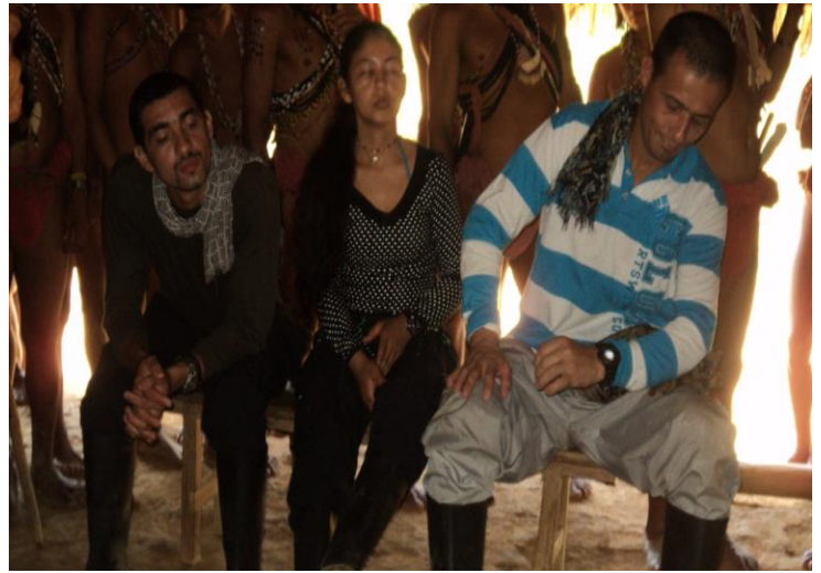
Cansado de escuchar hablando la voz de Comunidad