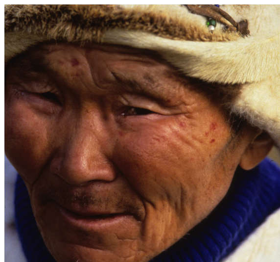
Rentierhirte in Sibirien, Russland