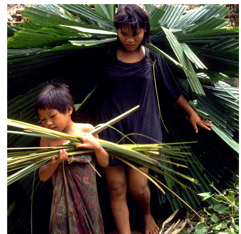
Die Penan sind nur eines von vielen indigenen Völkern die vom Klimawandel betroffen sind