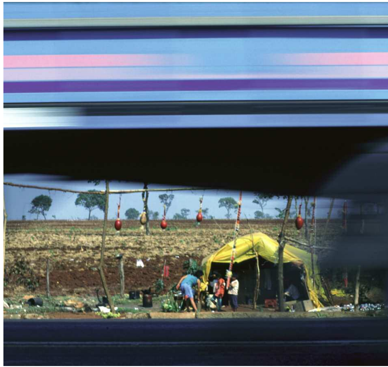
Die Guarani in Brasilien sind von ihrem Land vertrieben worden, viele leben jetzt in Zelten am Straßenrand.

„Somit dient das Projekt als positiver Beitrag des Landes zum Schutz und zur Verbesserung der globalen Umwelt, in Einklang mit der ‚Framework Convention on Climate Change‘...Im Vergleich zu fossilen Brennstoffen ist