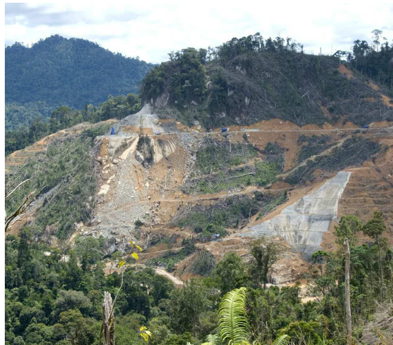
Der Murum-Damm befindet sich im Bau und wird vielen Penan ihre Heimat kosten.

In ihrem Appell an die internationale Gemeinschaft, die Rettung des Waldes finanziell zu unterstützen, beruft sich die kenianische Regierung auf den Klimawandel als einen entscheidenden Beweggrund.