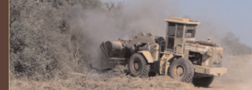
Bulldozer in azione per disboscare le foreste dei Totobiegosode.

di distruggere la terra nativa dei Totobiegosode e di convertirla in pascolo. Queste azioni sono un'evidente violazione sia delle leggi paraguaiane sia del diritto internazionale, e avrebbero conseguenze devastanti per gli Indiani Totobiegosode isolati.