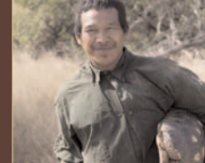
Esoi, un Totobiegosode, di ritorno dalla caccia.

Scrivi al Presidente del Paraguay! Chiedigli di rispettare la Costituzione e le leggi paraguaiane, e di assegnare la terra agli Ayoreo-Totobiegosode al più presto. Per favore, scrivi anche a Marcelo Bastos Ferraz, rappresentante della Jaguarete Pora, e manifestagli la tua preoccupazione sui progetti dell'azienda