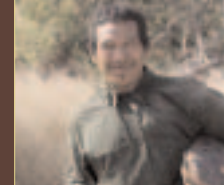
Esoi, un Totobiegosode, de retour de la chasse.

Ecrivez au président du Paraguay pour l'exhorter à se conformer aux lois et à la Constitution paraguayennes en accordant d'urgence un titre de propriété foncière aux Ayoreo-Totobiegosode.