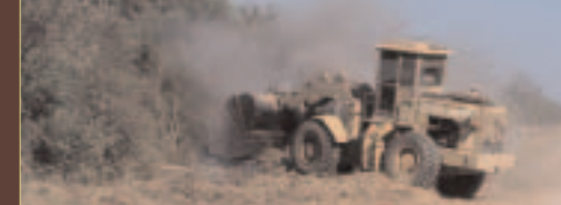
Des bulldozers détruisent la forêt des Totobiegosode.