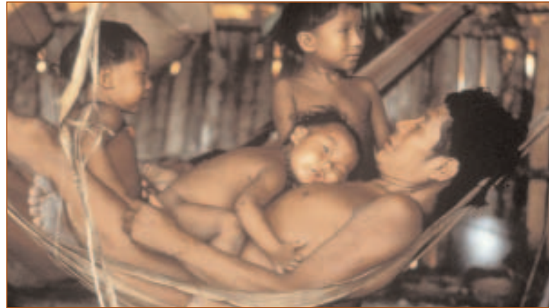
Famille yanomami, Brésil

Pour la chasse, les Yanomami emploient des arcs et des flèches souvent enduites de curare. Bien que le produit de la chasse ne représente que 10 % de leur nourriture, cette