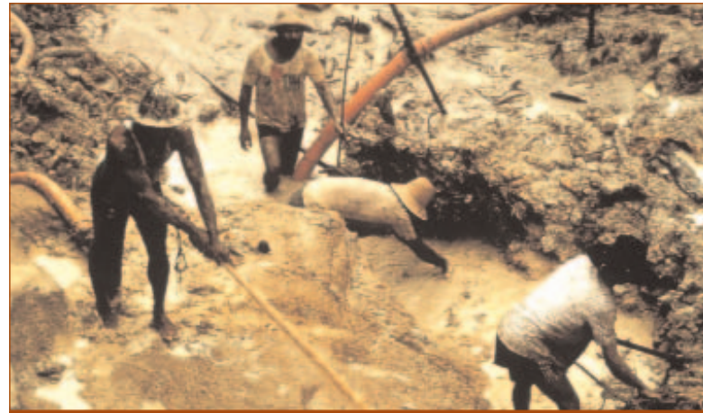
Chercheurs d'or sur le territoire yanomami, Brésil

L'armée tente de renforcer sa présence dans le secteur : outre la construction de nouveaux camps militaires, elle prévoit de rallonger sa principale piste d'atterrissage au cœur du territoire. Les Yanomami s'inquiètent, non seulement de l'afflux de population et de matériel que ces travaux entraîneraient, mais aussi des dommages qui seraient infligés à la forêt. Les soldats ont déjà forcé les femmes yanomami à la prostitution et certaines sont aujourd'hui atteintes de MST.