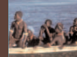
Dans une pirogue des autorités

et usent de violence à leur égard. Si cette situation continue, les Jarawa perdront leur indépendance et disparaîtront complètement. Je vous prie instamment de tenir les étrangers à l'écart de leur territoire, de fermer la route en vertu de la décision de la Cour suprême et de laisser les Jarawa décider eux-mêmes de leur avenir'.