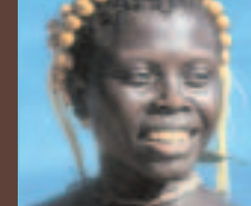
Une femme jarawa

Écrivez au gouvernement indien en recopiant ce texte ou écrivez librement : 'Je suis très préoccupé(e) par la situation des Jarawa des îles Andaman. Des colons s'introduisent dans leur réserve, chassent le gibier dont ils dépendent, introduisent des maladies, les exploitent