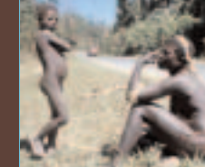
Sur le bord de la route